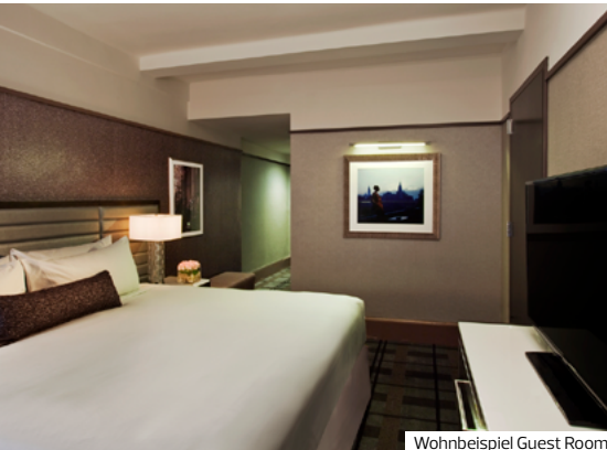
Wohnbeispiel Guest Room

New York City ist die unumstrittene Marathonmetropole. Wer keinen ganzen Marathon laufen möchte, kommt beim NYC Halbmarathon durch die faszinierende Stadt auf seine Kosten.